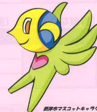
摂津市マスコットキャラクター セッピー